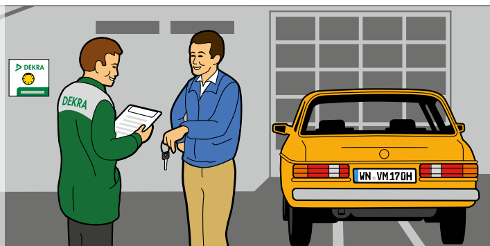
Freundlicher Kundenservice: Für DEKRA eine Selbstverständlichkeit.

DEKRA kann diese mit der Oldtimer-Prüfdokumentation bestätigen.