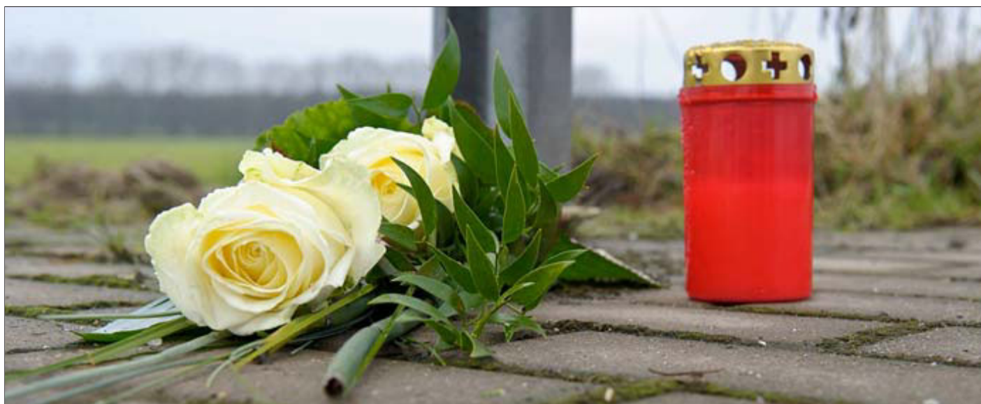
Trauer über den Unfalltod der Freundinnen: Unbekannte zeigten mit Blumen und einem Grablicht an der Unfallstelle ihre Anteilnahme. Kurz nach dem Unfall der jungen Lohnerinnen am Freitag verlor in der Nacht zum Sonntag – ebenfalls auf der Bundesstraße 69 – ein 18-jähriger Pkw-Fahrer aus Vechta sein Leben.