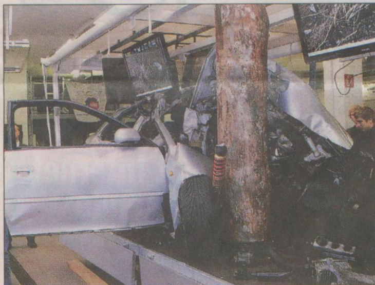
Wo früher der Motor war, steht ein Baumstamm.

Begleitet wird der Audi immer von Mitarbeitern der Polizei oder Verkehrswacht, die mit Schülern und Jugendlichen anhand des Fahrzeuges regelrechten Unterricht betreiben. Mehrere Flachbildschirme, die über dem A3 montiert sind, klären über Hintergründe auf und zeigen einen eindrucksvollen Film zum Unfallhergang, der vom Fernsehsender VOX bereits gezeigt und der Verkehrswacht zur Verfügung gestellt wurde.